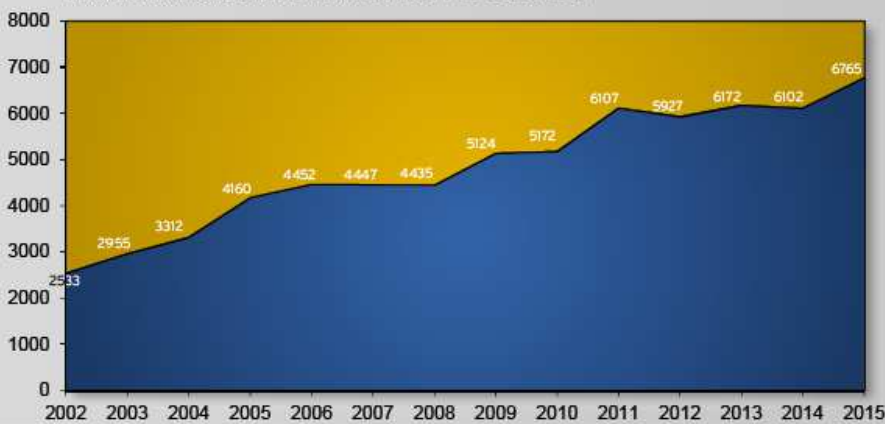
TEILNEHMERENTWICKLUNG KÄRNTEN LÄUFT 2002 BIS 2015

...Die regionale Wertschöpfung beträgt rund 2,4Mio.€ und der generierte Medienwert über 2,2Mio €.